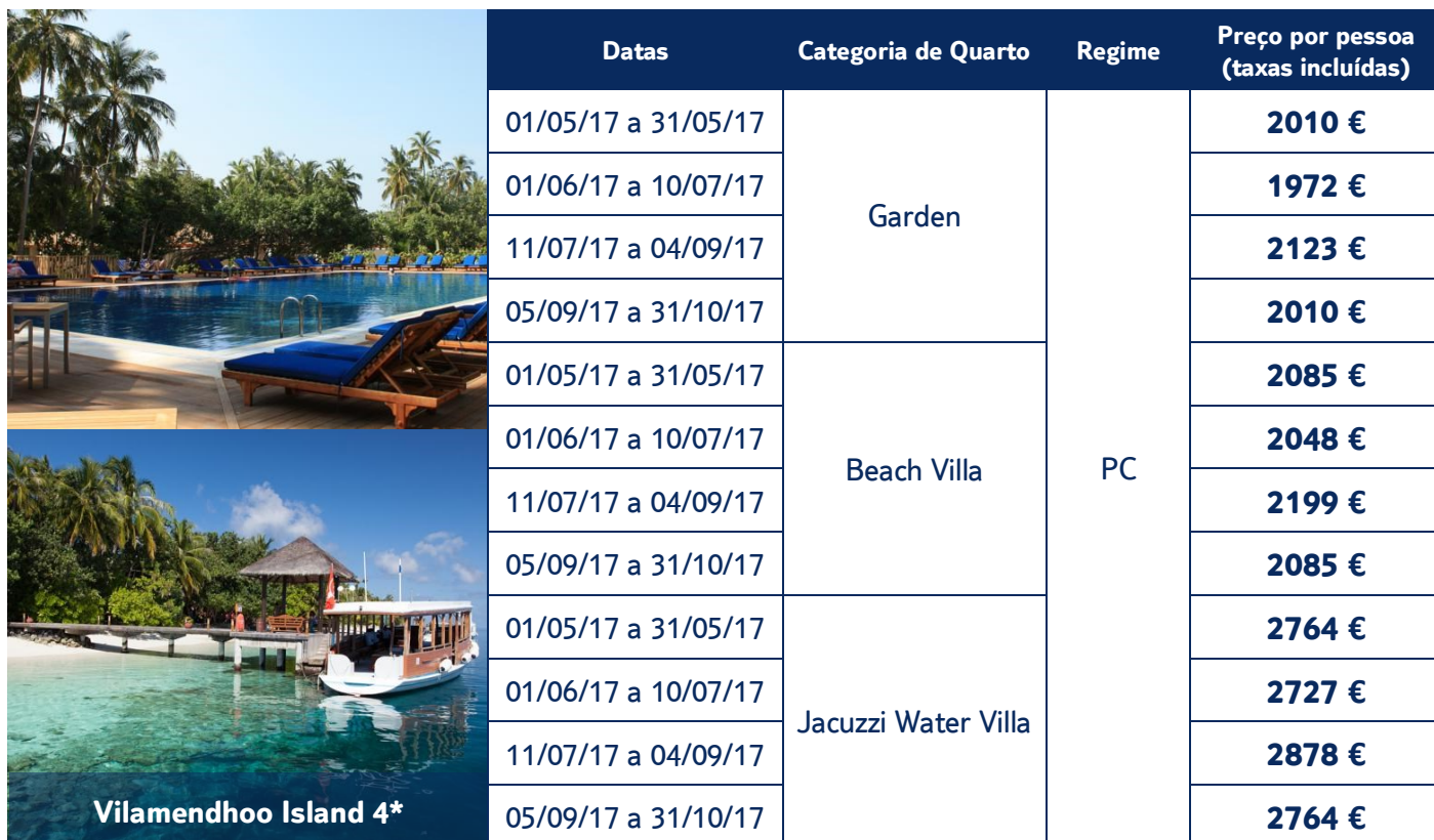
Vilamendhoo Island 4*